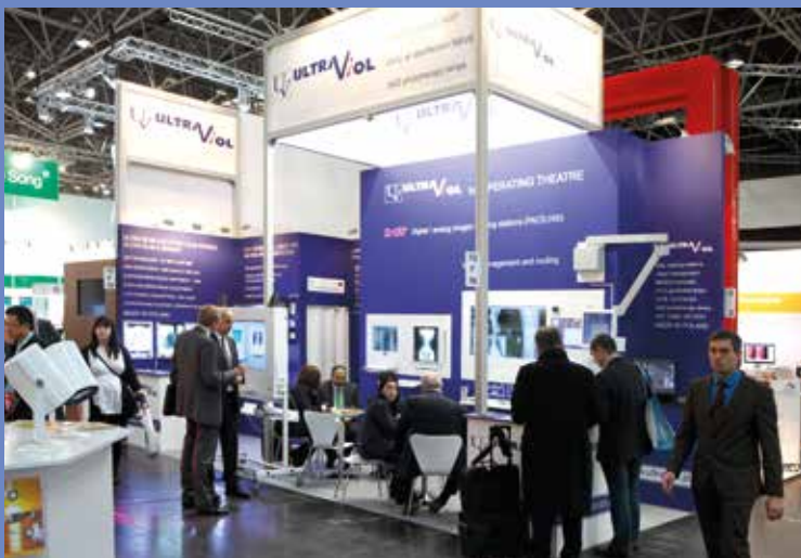
Targi Medica 2013 w Düsseldorfie