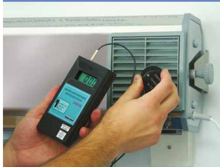
Bezpieczne dla ludzi – pomiar miernikiem napromieniowania wskazuje zero