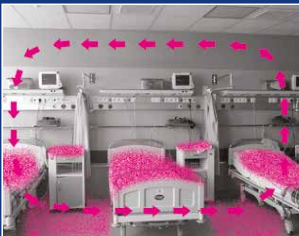
Skazone powietrze w sali bez lamp bakteriobójczych