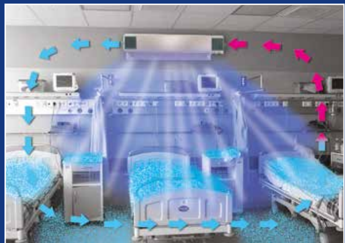
Proces oczyszczania powietrza promiennikami wewnętrznymi – funkcja I i zewnętrznymi – funkcja II (powietrze i powierzchnie)