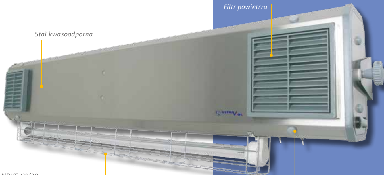
NBVE 60/30 NBVE 110/55