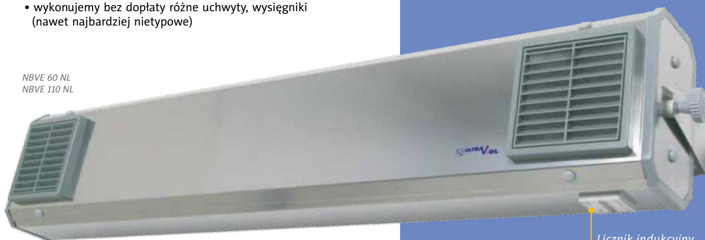
Licznik indukcyjny czasu pracy