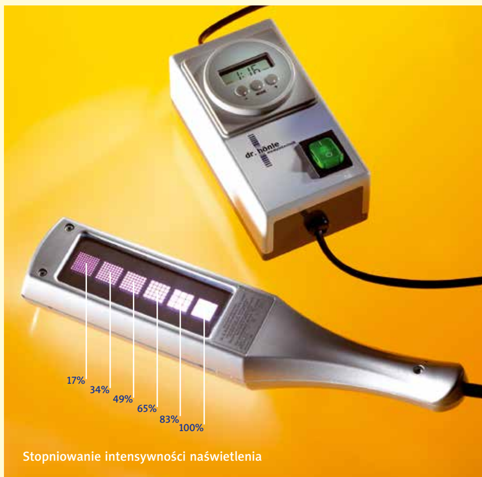
Stopniowanie intensywności naświetlenia