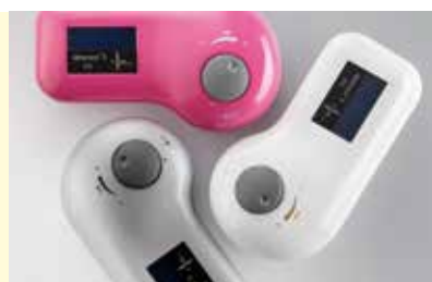
Idromed® 5 PS do wyboru w kolorach różowym, białym lub srebrnym

Badania naukowe przeprowadzone nad terapią z wykorzystaniem pulsującego prądu stałego w urządzeniu idromed® 5 PS wykazały, że dzięki zastosowaniu nowego rodzaju prądu, jest ona optymalną formą leczenia wrażliwych pacjentów, szczególnie dzieci oraz ludzi młodych. Działanie prądu terapeutycznego jest prawie niewyczuwalne a prawdopodobieństwo wystąpienia skutków ubocznych zostało zminimalizowane. Dłonie oraz stopy mogą być wyjęte z basenu w trakcie terapii bez zagrożenia wystąpienia „efektu bariery elektrycznej” (szoku elektrycznego).